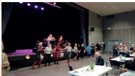
Organisation annuelle du thé dansant des aînés à l'Espace Bellevarde