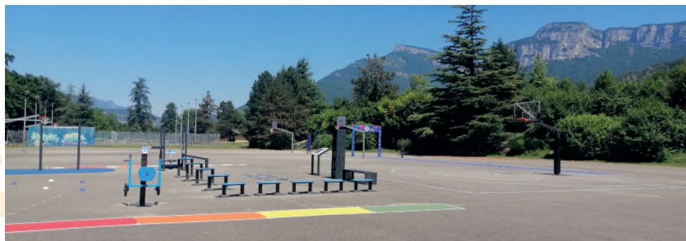
Anneau sportif à la base de loisir du plan d'eau : terrain de basket 3x3, aires de fitness dont 1 spécifiquement dédiée aux seniors.