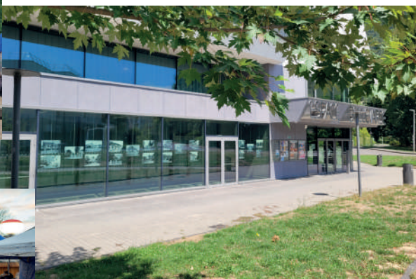
Exposition permanente de photos anciennes à découvrir depuis l'extérieur de l'Espace Bellevarde.