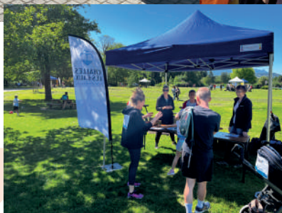
Stand de la mairie de Challes-les-Eaux à la 2 e édition du Défis Challes en 2025.