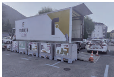
Déchetterie mobile de Grand Chambéry proposée à Challes-les-Eaux 4 fois par an.