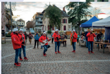
Animation d'un orchestre de rue pendant les Illuminations de Challes le 5 décembre 2025.