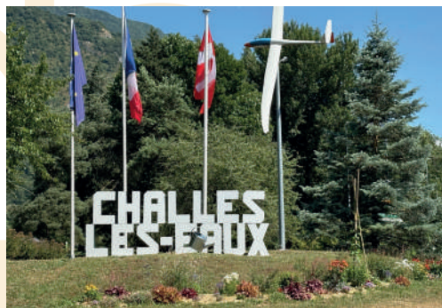
Lettrages en 3D installés sur les ronds-points d'entrée de la ville.