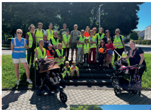
Participants à la 2 e édition du Challes Ange Propre.