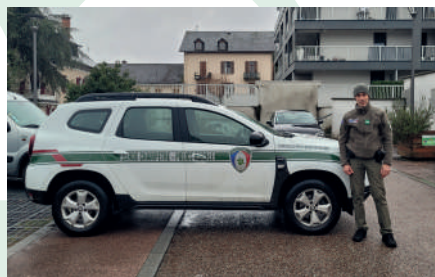
Arrivée en 2025 d'un garde-champêtre intercommunal.