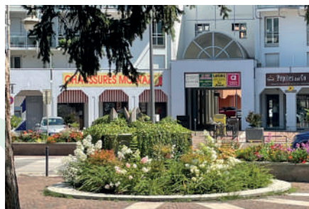
Fontaine en centre-ville.