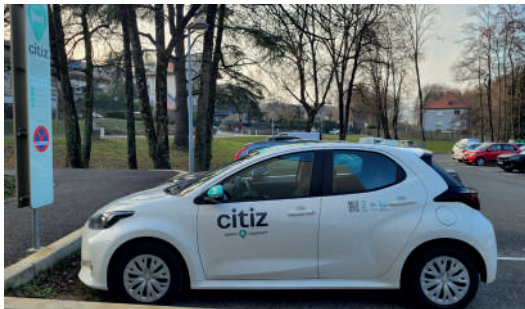
Offre d'auto-partage CITIZ au parking Bellevarde.