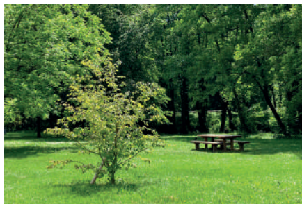
L'un des nombreux espaces verts de la commune.