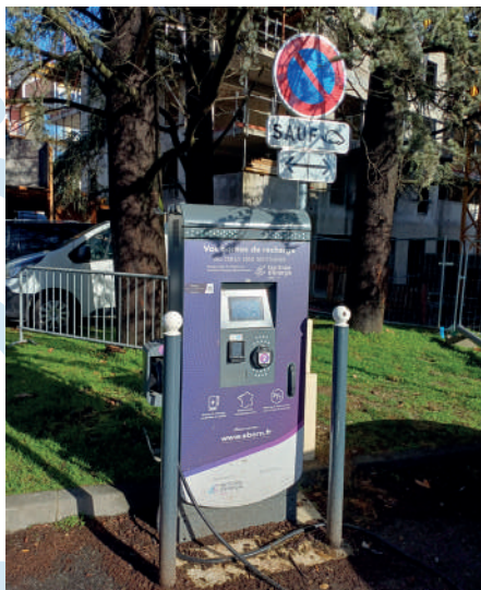
Borne de recharge pour véhicules électriques au parking Beauséjour.