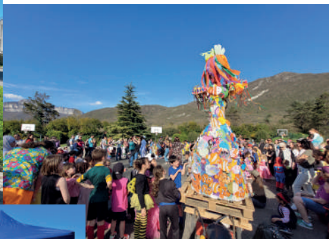
Organisation du carnaval en 2025 en partenariat avec les associations et les services municipaux.