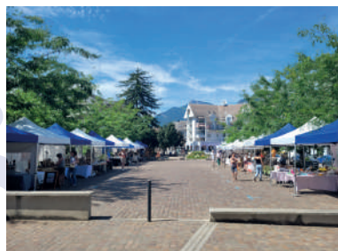
Marché estival de producteurs et artisans locaux pendant la fête de l'été en centre-ville.